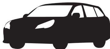
ステーションワゴン