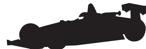
フォーミュラカー